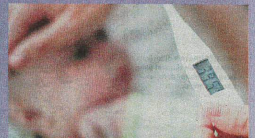
PETANDA komplikasi lebih teruk berlaku yang ibu bapa perlu peka adalah apabila anak mengalami demam berpanjangan selepas demam yang pertama.

Sesi persekolah kembali dibuka selepas musim cuti dan perayaan hujung tahun, orang ramai, khususnya kanak-kanak digalakkan berhati-hati apabila berada di khalayak ramai dengan memakai topeng muka dan menjaga kebersihan seperti mencuci tangan.