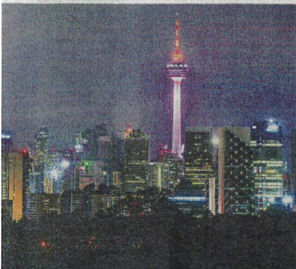
Adakah vaksin diambil sudah kurang berkesan dalam melindungi

influenza dan tibi yang masih kekal di sekeliling kita sehingga ke hari ini," katanya.